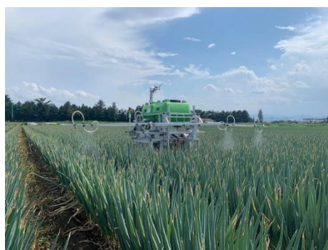
《自律走行農薬散布ロボット》

露地野菜栽培における自律走行型ロボットを活用した農薬散布及びリモート圃場カメラを活用した遠隔農地の状況確認の技術導入により、作業効率化によるコスト削減の実証を行う。